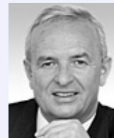
Prof. Dr. rer. nat. Martin Winterkorn, Vorsitzender des Vorstands, Volkswagen AG

Teilnehmer der Panel Diskussion und Referenten des Münchner Management Kolloquiums 2011